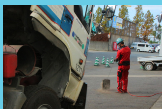
エアフィルターエアブロー