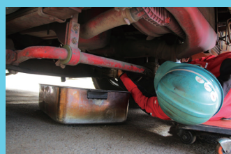
トラックオイル交換