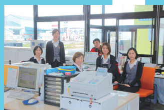
働きやすい職場環境