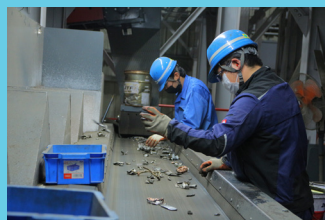
手作業による選別